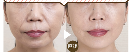
↑ヒアルロン酸をほうれい線に注入