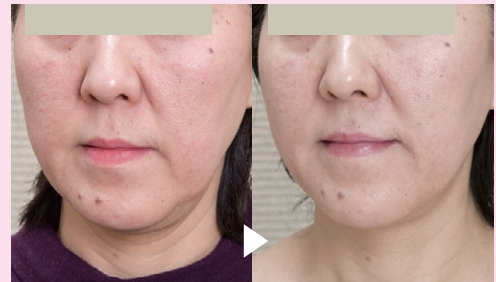
↑エクシリス1回目、照射直後